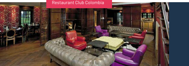
Restaurant Club Colombia